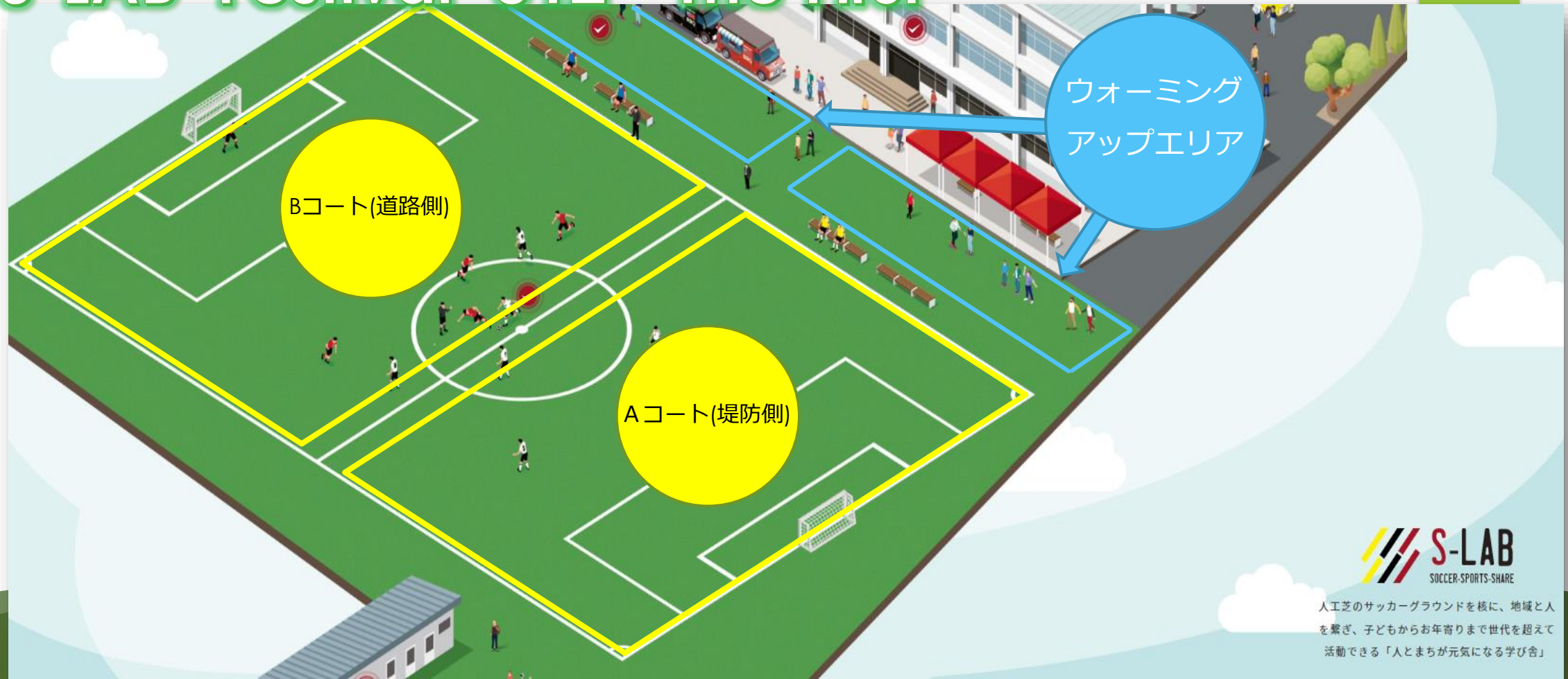
グラウンド詳細図